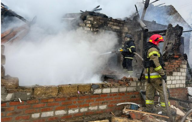
Фото: окупанти вдарили по Балаклії на Харківщині

Російські окупанти 24 квітня атакували Балаклію у Харківській області. Ворог завдав ударів дронами по центру міста, внаслідок чого виникли пожежі та загинули люди.