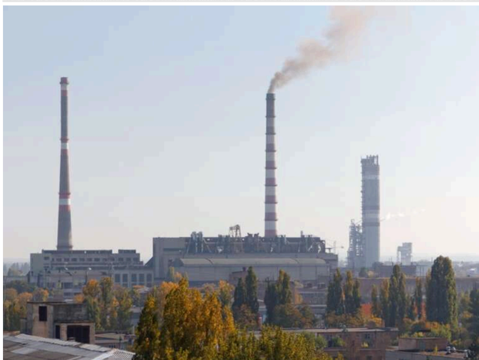
Когенерація для Черкас: «Хімволокно» замовило німецьку установку за 85 мільйонів гривень – дорожче, ніж у Харкові та Києві

ПРАТ «Черкаське хімволокно» 27 квітня замовило ТОВ «Далгакиран Компресор Україна» когенераційну установку за 85,65 млн грн, або 1,62 млн євро (тут і далі ціни вказано з ПДВ).