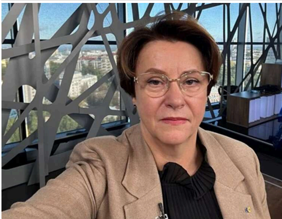
Южаніна заявила про існування неpubлічного законопроєкту щодо виборів під час війни

Існує прихована версія законопроєкту про вибори під час війни, яка відрізняється від тієї, над якою відкрито працюють депутати, — нардепка Ніна Южаніна.