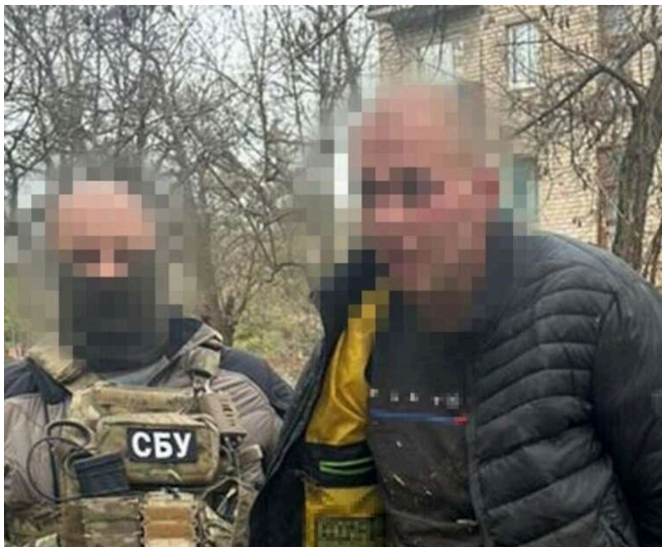
Коригував удари та палив техніку: в Краматорську затримали агента ГРУ, якому загрожує довічне

У Донецькій області Служба безпеки України виявила та арештувала агента російської військової розвідки, який сприяв ворогу в коригуванні обстрілів Краматорська. Крім збирання розвідувальної інформації, він ще й спалив бронемашину ЗСУ, яка виконувала завдання на передовій.