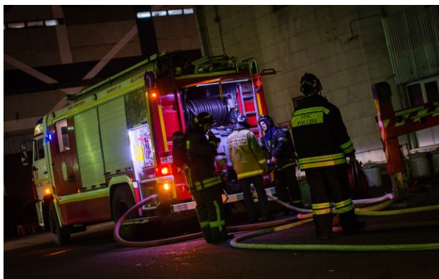
Фото: вибухи лунали на півострові всю ніч

У тимчасово окупованому Севастополі в ніч на 18 квітня пролунала серія вибухів. За даними моніторингових каналів, безпілотники атакували порт та об'єкти інфраструктури.