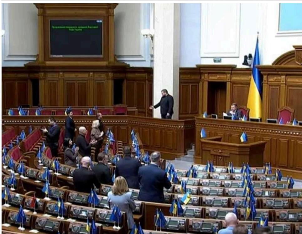
Парламент на паузі: порожня зала Ради знову ставить під загрозу ухвалення критичних законів

Криза у Верховній Раді триває – у сесійній залі відсутньо багато нардепів.