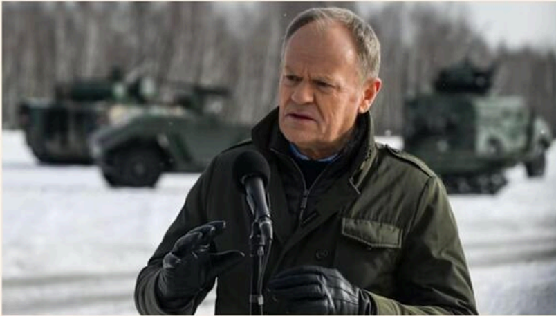
Polish Prime Minister Donald Tusk warned that Russia could attack an alliance member in 'months'

Donald Tusk says EU should bolster its own Article 42.7 mutual defence clause