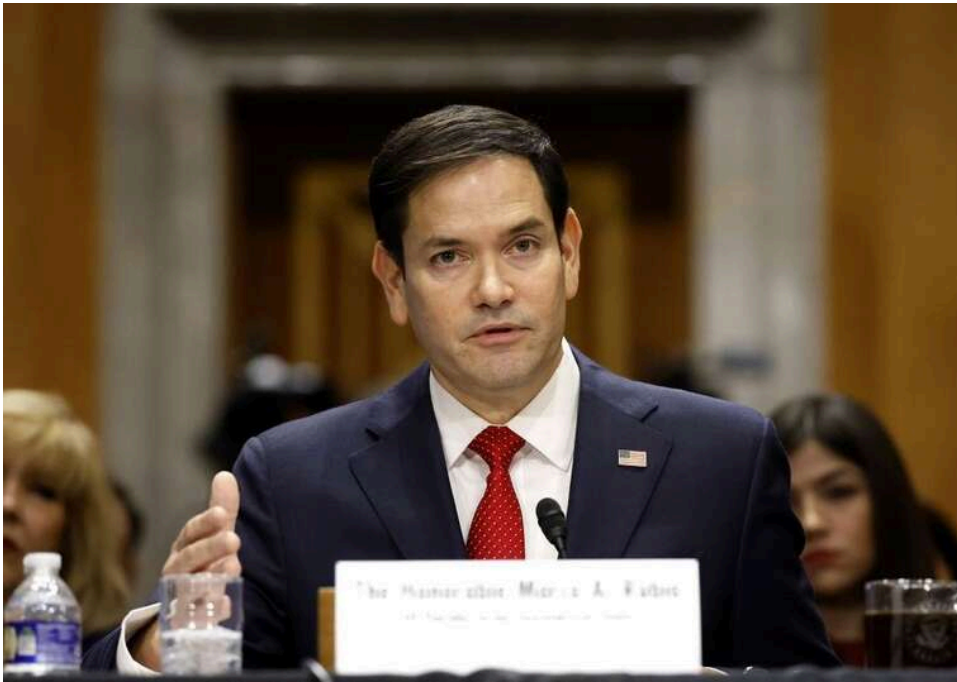
Держсекретар Рубіо заявив, що США чекають на збірну Ірану на ЧС-2026

Державний секретар Рубіо заявив, що США з радістю приймуть іранську збірну на своєму домашньому чемпіонаті світу.