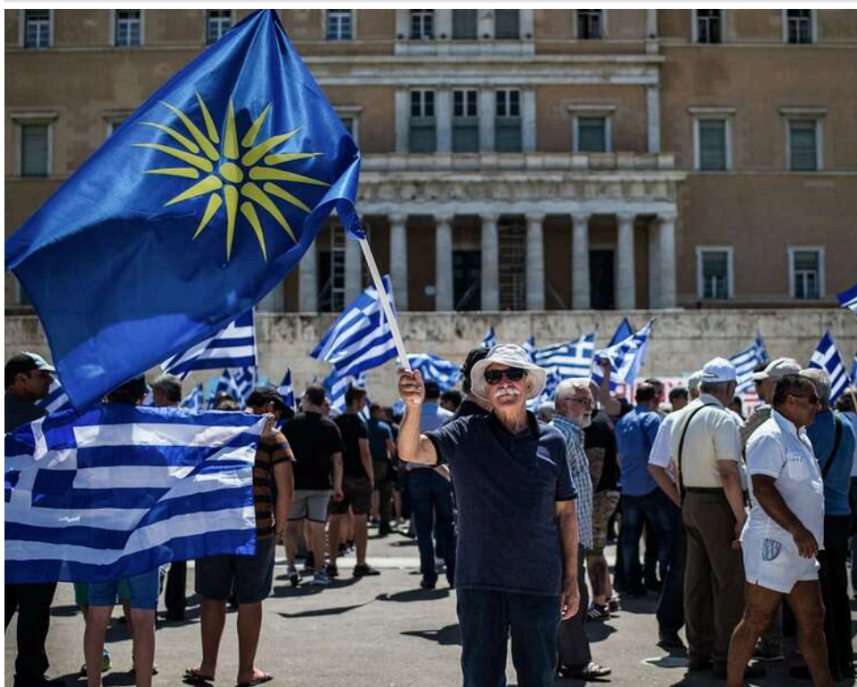
Грецьке економічне диво: держборг впаде до 137% ВВП, випередивши показники Італії вже цього року

До кінця цього року Греція перестане бути країною з найбільшим боргом у Єврозоні, а її державний борг знизиться до рівня, нижчого за італійський.