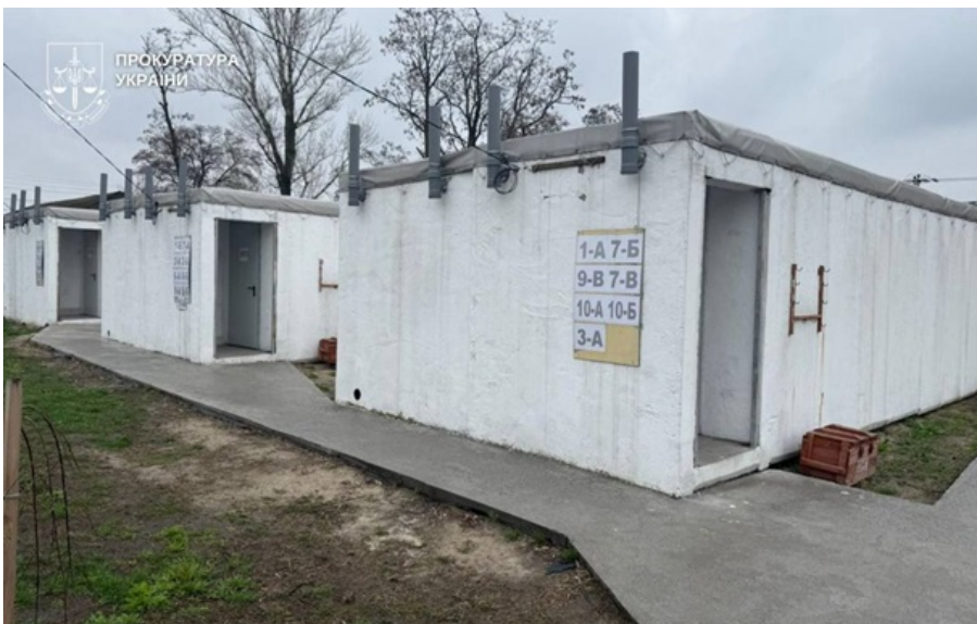
На Дніпропетровщині підозрюють ексочільника громади

Укриття мали забезпечити безпеку учнів, педагогів і мешканців громади під час повітряних тривог.