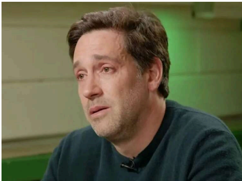
Кінець епохи Орбана: в Угорщині відкрили справу проти головного медіамагната експосадовців Дьюли Балаші

Поліція Угорщини відкрила розслідування щодо власника кількох великих медіакомпаній за підозрою в нецільовому використанні коштів та відмиванні грошей, повідомляє Reuters. Поліція не назвала імені, однак її заява надійшла відразу після заяви медіамагната Дьюли Балаші, який повідомив, що рахунки кількох його компаній були нещодавно заморожені.