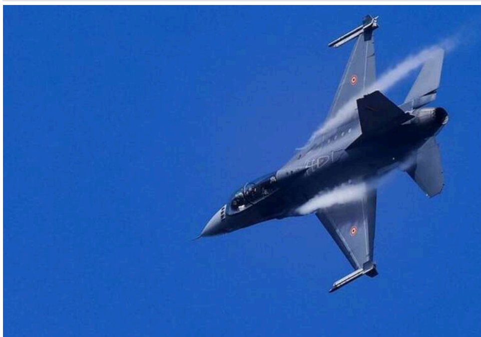
Business Insider: Українські пілоти навчаються літати без GPS через російське глушіння

Українські військові льотчики адаптуються до нових умов ведення війни, опановуючи польоти без сигналу GPS, який часто приглушується засобами радіоелектронної боротьби.