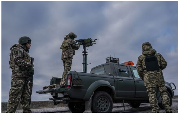
Фото: росіяни атакували вночі дронами та ракетами (Getty Images)

Обирайте перевірене - додайте РБК-Україна до улюблених джерел у Google