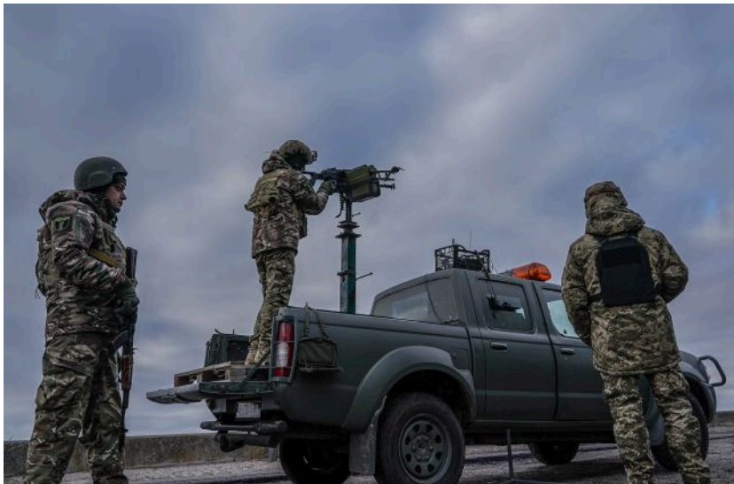
Фото: росіяни атакували вночі дронами та ракетами