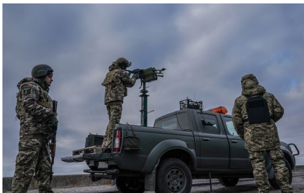
Фото: росіяни атакували вночі дронами та ракетами

Обирайте перевірене - додайте РБК-Україна до улюблених джерел у Google