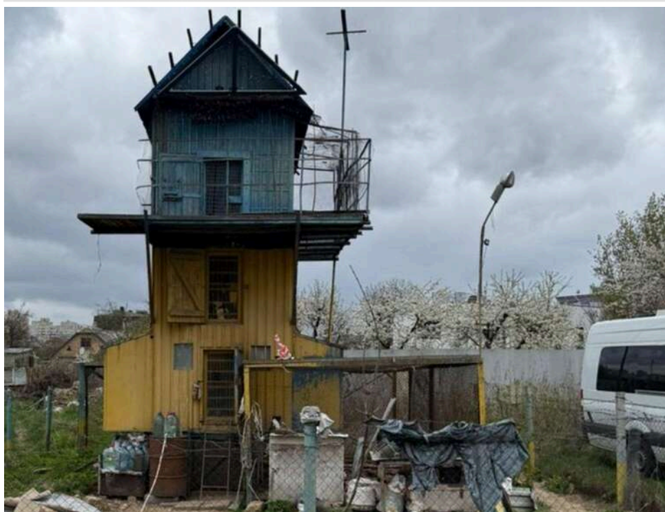
Голубник замість багатоповерхівки: суд Києва зірвав схему привласнення 0,5 га землі в Святошинському районі

За позовом Святошинської окружної прокуратури Києва Господарський суд зобов'язав власника знести самочинну споруду, припинити володіння нерухомим майном та скасувати державну реєстрацію земельної ділянки, де розташована ця нерухомість.