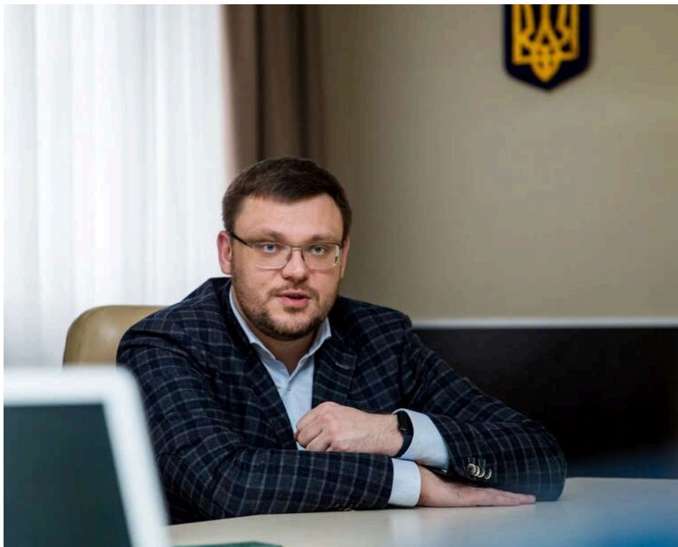
НАБУ про Єрмака: докази аналізуються, а про підозру повідомимо за фактом вручення

Голова Національного антикорупційного бюро України (НАБУ) Семен Кривонос висловився щодо перспективи оголошення підозри ексочільнику Офісу президента Андрію Єрмаку, підкресливши, що правоохоронці не повідомляють про такі кроки заздалегідь.