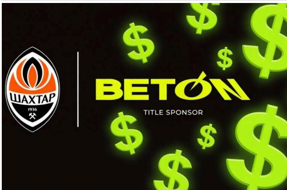
Зв'язки з Офісом Президента та орбіта Ахметова: хто стоїть за брендом ВЕТОН, який став титульним спонсором «Шахтаря»

Оператор грального ринку ВЕТОН став титульним спонсором ФК «Шахтар» (Донецьк), що одразу порушує питання про реальних бенефіціарів цього бренду та їхні зв'язки з великою політикою.