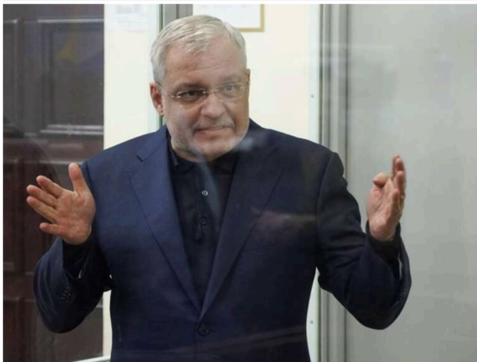
АРМА зафіксувало незаконне користування будинком ексміністра-втікача Захарченка в центрі Києва, де проживав фігурант справи "Мідас" Герман Галущенко

Національне агентство з розшуку та менеджменту активів (АРМА) виявило незаконне використання арештованого майна – житлового будинку в центрі Києва, відомого як будинок Захарченка.