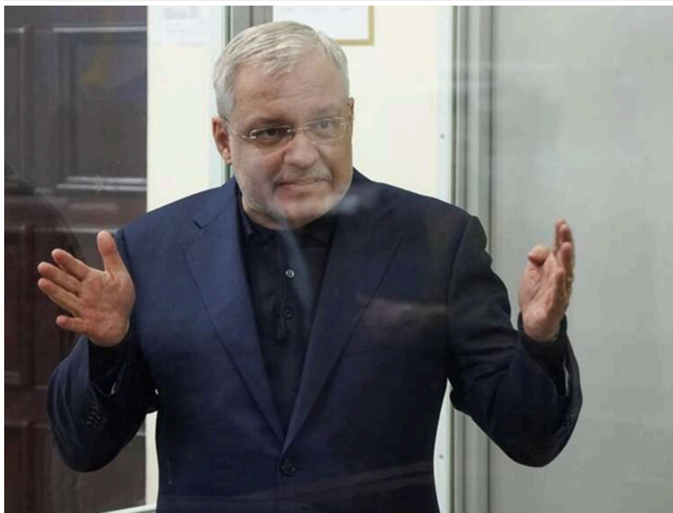
АРМА зафіксувало незаконне користування будинком ексміністра-втікача Захарченка в центрі Києва, де проживав фігурант справи "Мідас" Герман Галущенко

Національне агентство з розшуку та менеджменту активів (АРМА) виявило незаконне використання арештованого майна – житлового будинку в центрі Києва, відомого як будинок Захарченка.