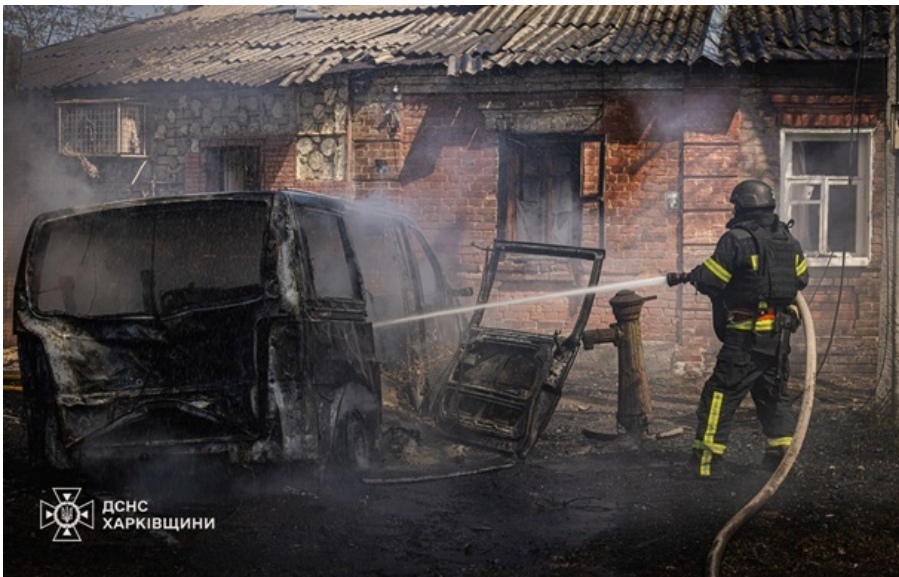
Ліквідація наслідків російської атаки в Харкові

У місті пошкоджено 38 приватних будинків, торговельний павільйон, а також згорів автомобіль.