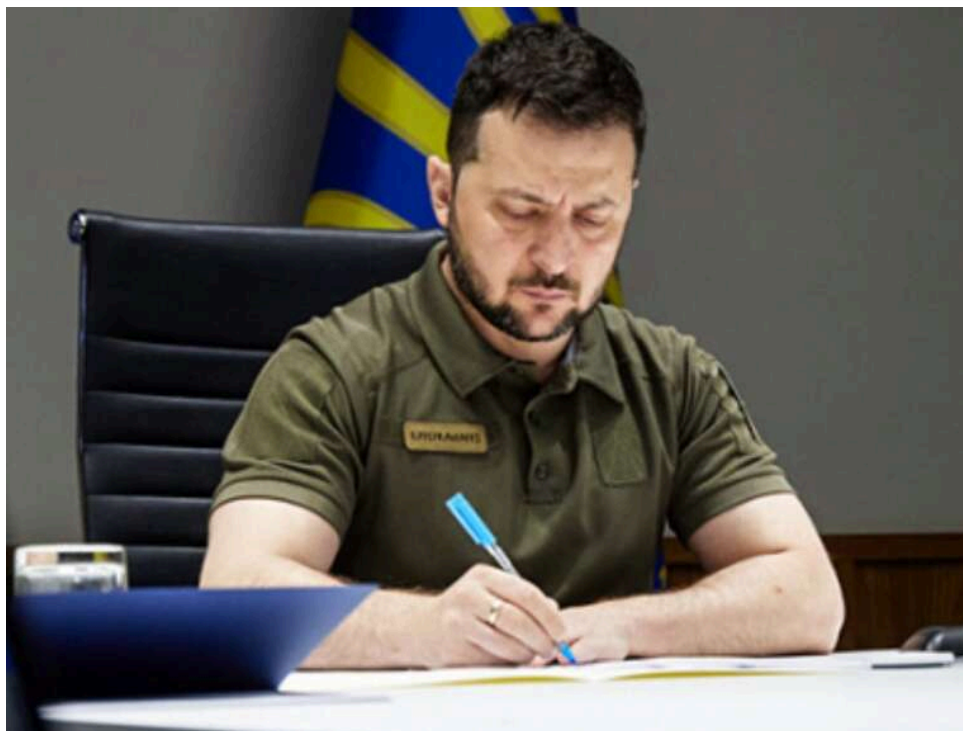
Зеленський підписав закон про санкції проти російського "тіньового флоту"

Президент України Володимир Зеленський ввів санкції проти "тіньового флоту" РФ, підписавши відповідний закон, який раніше підтримала Верховна Рада.