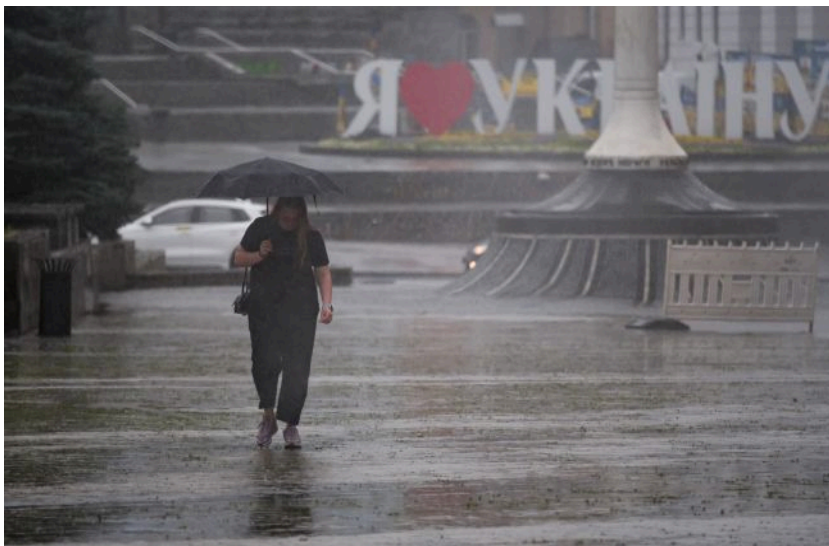
Погода в Україні місцями змінюється