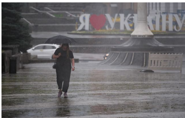
Погода в Україні місцями змінюється

Обирайте перевірене - додайте РБК-Україна до улюблених джерел у Google