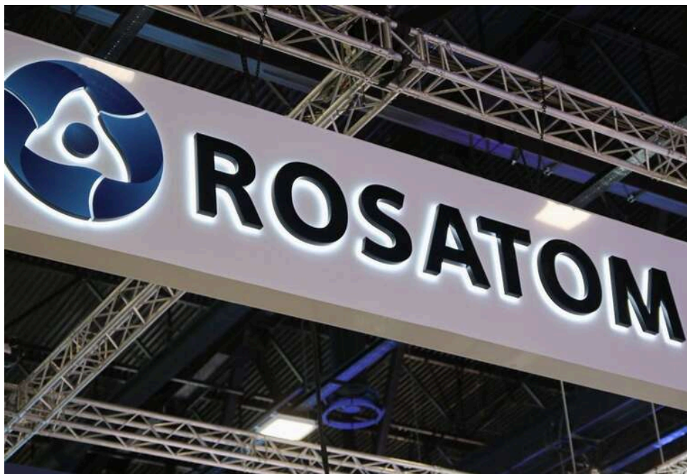
Зеленський запровадив санкції проти 35 осіб і компаній, пов'язаних із «Росатомом» та енергетикою РФ

Володимир Зеленський, президент України, указами запровадив нові персональні та секторальні санкції проти 35 фізичних і юридичних осіб, пов'язаних з держкорпорацією "Росатом" та енергетичними компаніями Росії.