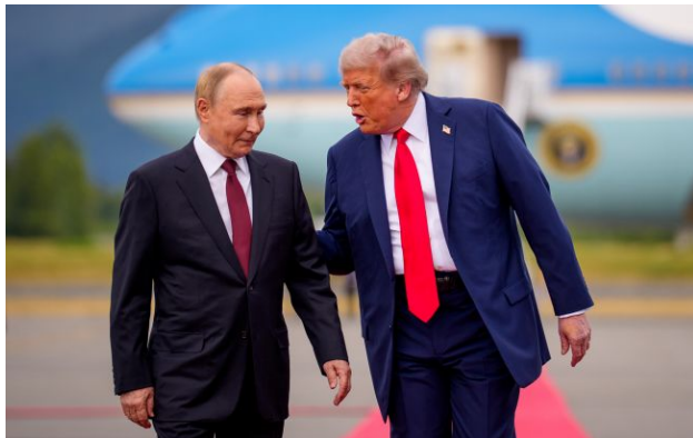
Фото: Володимир Путін і Дональд Трамп (Getty Images)

Президент США Дональд Трамп заявив, що він не запросив главу Кремля Володимира Путіна на саміт G20. Однак він вважає, що такий візит був би корисним.