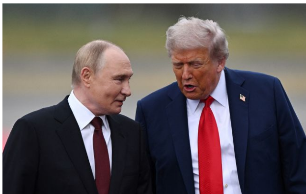
Фото: Володимир Путін і Дональд Трамп

США мають намір запросити главу Кремля Володимира Путіна на саміт лідерів G20, який пройде в грудні в гольф-клубі президента США Дональда Трампа "Дорал" у Маямі.