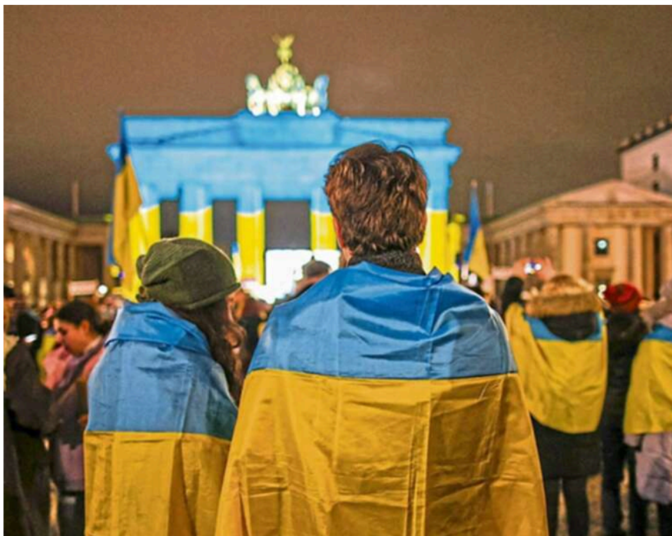
Понад мільйон українських чоловіків у ЄС: Німеччина, Польща та Чехія стали лідерами за кількістю біженців

Найбільше українських чоловіків віком від 18 до 64 років зі статусом тимчасового захисту проживає в Німеччині – 312,2 тисячі осіб.