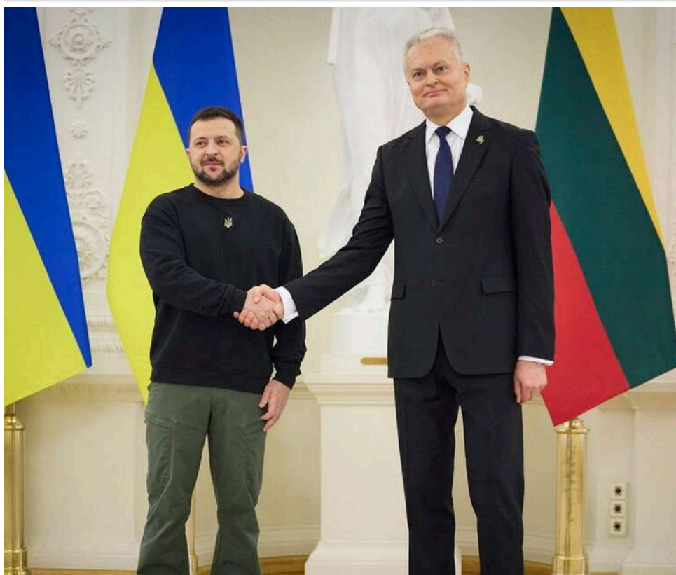
Зеленський і Науседа домовилися про нові кроки в оборонному виробництві

Президент України Володимир Зеленський провів зустріч із президентом Литви Гітанасом Науседа та обговорив перспективи розширення співробітництва у сфері оборонного виробництва.