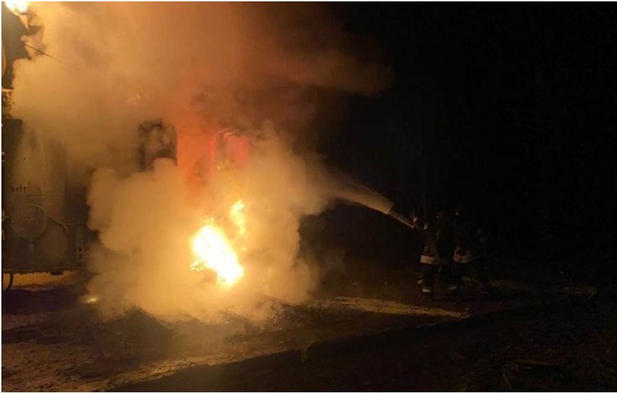
Враг снова ударил по гражданской инфраструктуре Одессы

Предварительно пострадали четыре человека. Очевидцы сообщали о попадании "Шахедов" в несколько жилых домов и возгорании многоэтажного здания.