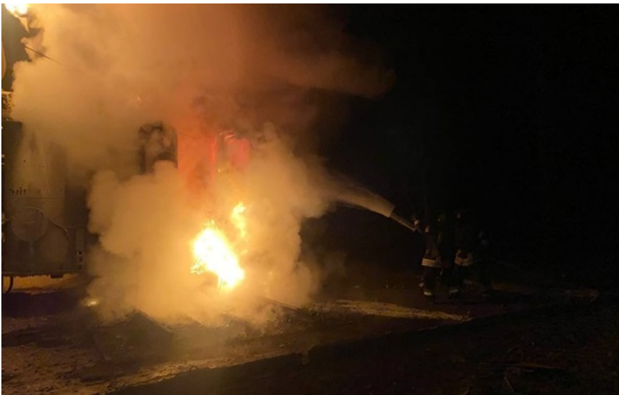
Враг снова ударил по гражданской инфраструктуре Одессы

Предварительно пострадали четыре человека. Очевидцы сообщали о попадании "Шахедов" в несколько жилых домов и возгорании многоэтажного здания.