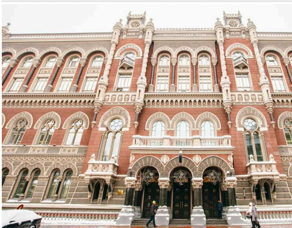
Мільярд за тиждень: НБУ масово розпродас резерви, щоб врятувати гривну від стрімкого падіння

Регулятор витрачає валютні резерви на тлі девальваційного тиску.