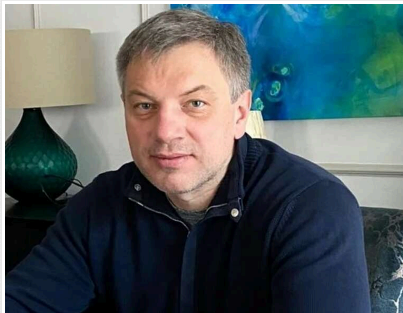
Неякісні міни та 3 мільярди збитків: суд відмовив компанії Андрія Дудника у зустрічному позові проти Міноборони

Читати на руском Read in English Додати як бажане джерело в Google