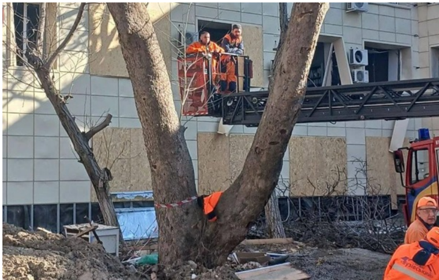
Существенно поврежден родильный дом

Атака врага привела к повреждению гражданской, жилой и портовой инфраструктуры; больше всего пострадал Одесский район.