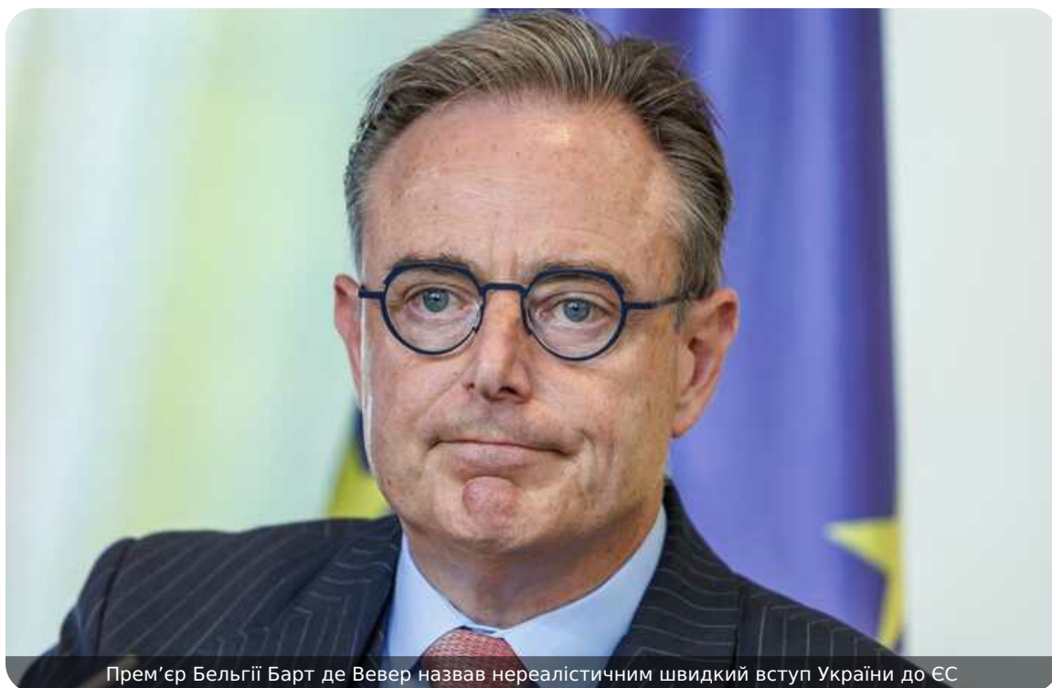
Прем'єр Бельгії Барт де Вевер назвав нереалістичним швидкий вступ України до ЄС

Прем'єр-міністр Бельгії Барт де Вевер заявив, що швидкий вступ України до ЄС наразі виглядає нереалістичним.