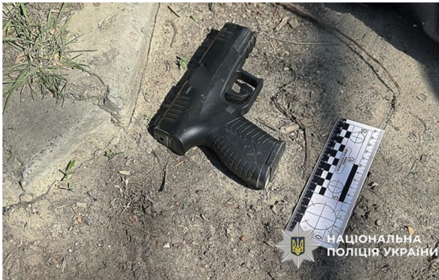
Изъятый пистолет

Военнослужащий несколько раз выстрелил в воздух и взорвал запал гранаты на улице возле арендованного жилья.