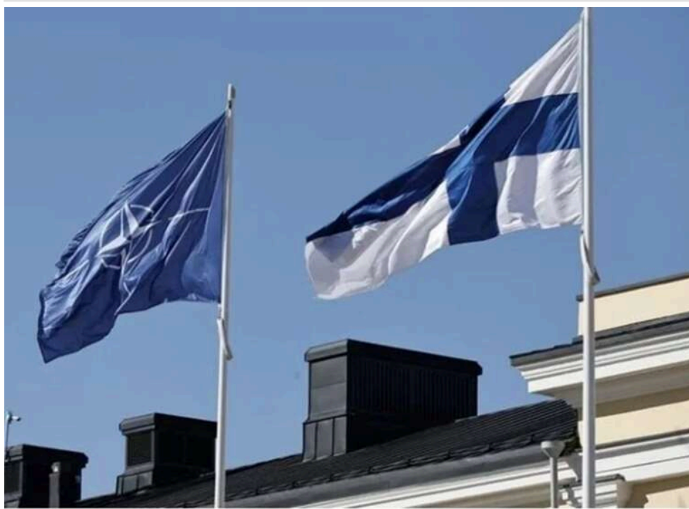
Кінець епохи нейтралітету: уряд Фінляндії ініціював скасування заборони на ядерну зброю

Міністерство оборони Фінляндії повідомило, що уряд країни пропонує зняти заборону на розміщення ядерної зброї на своїй території.