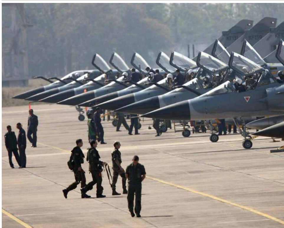
Розвідка F-16 та імітація пусків ASMP: Польські та французькі пілоти відпрацюватимуть відповідь на агресію РФ

Польща і Франція незабаром відпрацюють сценарії нанесення ядерних ударів по Білорусі та Росії в ході навчань, оголошених Макроном і Туском, над Балтійським морем і в північній Польщі, повідомляє Rzeczpospolita.