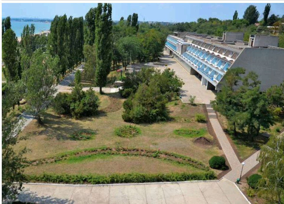
Мінус 11 гектарів: як у санаторію «Молода гвардія» намагаються «віджати» прибережну землю

У Верховній Раді з'явився законопроект, який, на перший погляд, виглядає максимально нейтрально й безпечно. Йдеться про законопроект №14342 з формулюванням «уточнення розміру земельної ділянки».