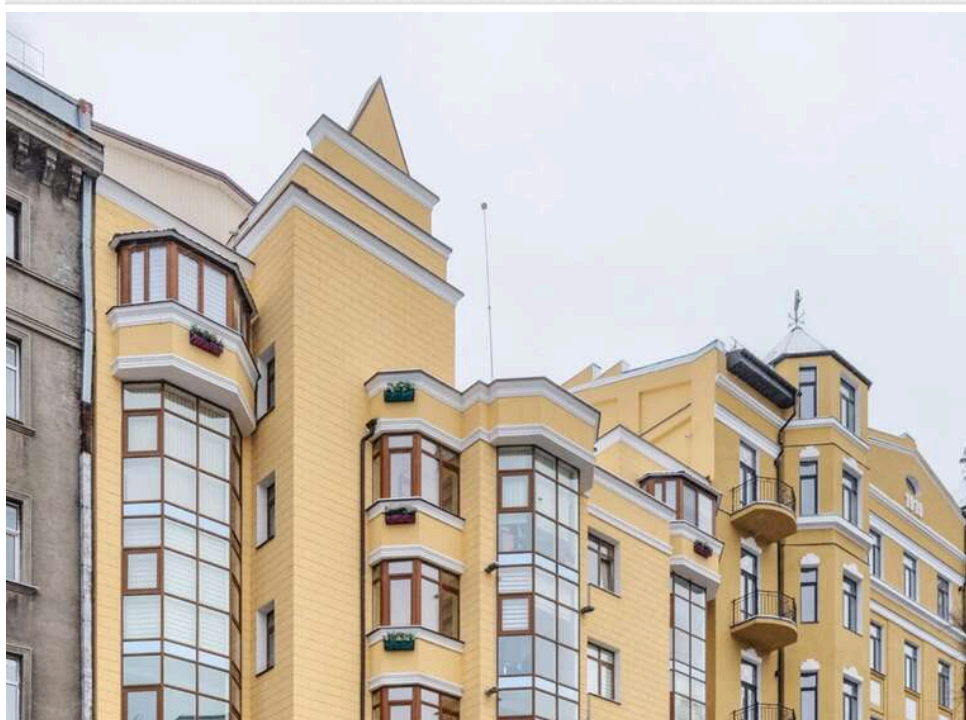
Рейдерство на 5 мільярдів: у родини судді через «чорних реєстраторів» відібрали бізнес-центр у центрі Києва

Будівля по вулиці Івана Франка, 15-а в Києві арештована в кримінальному провадженні про шахрайське заволодіння майном.