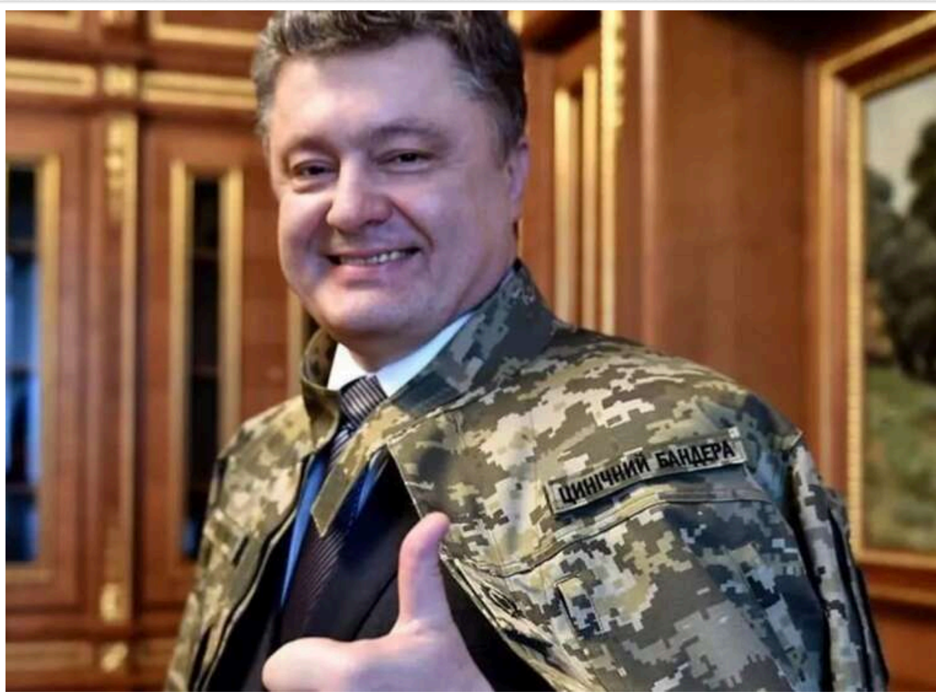
Неочікуваний рикошет: як оточення Порошенка повертає рейдерські методи часів Януковича