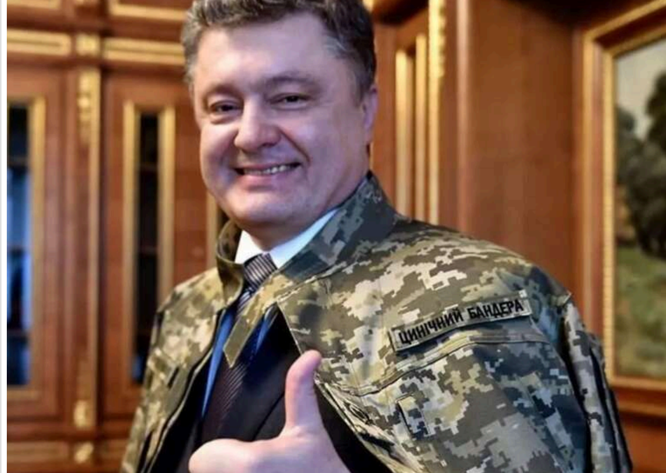
Неочікуваний рикошет: як оточення Порошенка повертає рейдерські методи часів Януковича

Читати на руськом Read in English Додати як базові джерела в Google