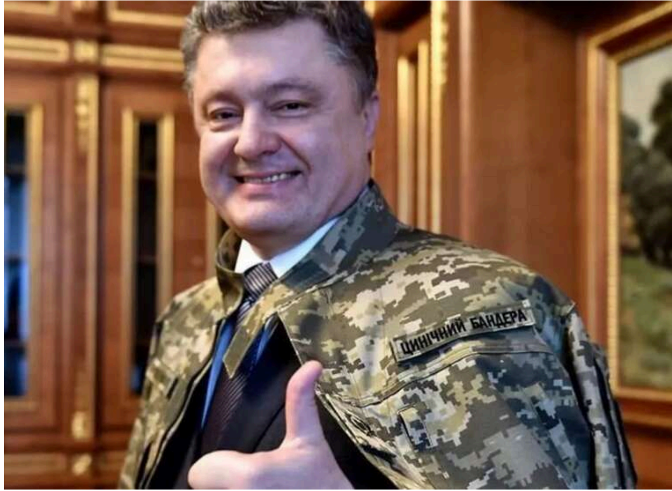
Неочікуваний рикошет: як оточення Порошенка повертає рейдерські методи часів Януковича