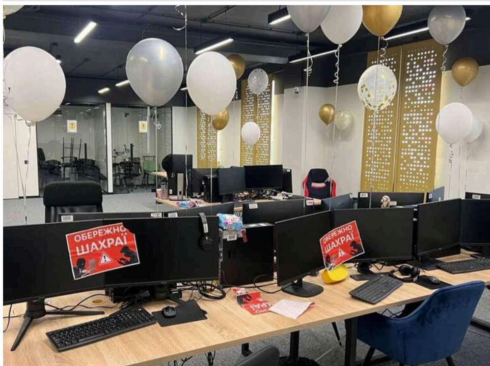
Велика війна кол-центрів у Києві: синдикат «Хімпром» почав агресивне захоплення мереж конкурентів

На цей час у Києві триває боротьба за сферу діяльності шахрайських кол-центрів. За наявною інформацією, синдикат "Хімпром" намагається витіснити конкурентів із мережі, щоб захопити нові ринки збуту. Вартість атак коливається від 5 до 30 тисяч доларів.