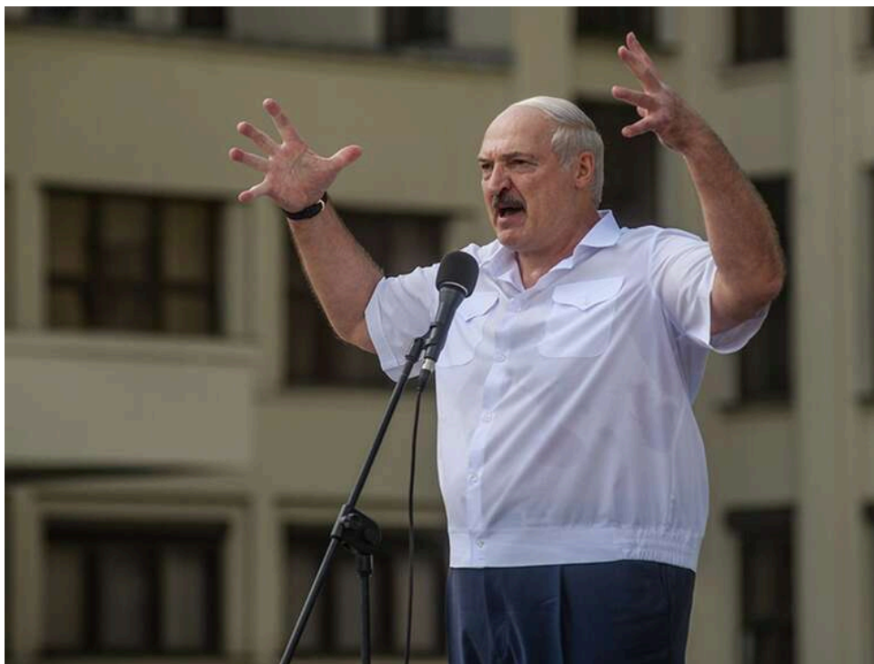
"Спалює безпілотник за два кілометри": Лукашенко похвалився новою лазерною зброєю

У Білорусі повідомили про розробку лазерної системи протидії безпілотникам. Вона може вражати цілі на відстані до 1,5-2 кілометрів.