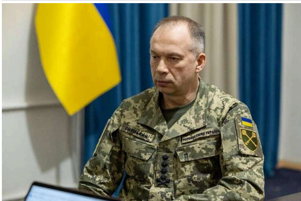
Нові правила Сирського: як працюватиме обов'язкова ротація на передовій та які граничні терміни встановлено для бійців

Головнокомандувач ЗСУ Олександр Сирський видав наказ про обов'язкову ротацію військових на передовій, визначивши граничні терміни перебування бійців на позиціях. Згідно з новими правилами, військові не повинні перебувати на передньому краї довше двох місяців, після цього їх мають замінювати.