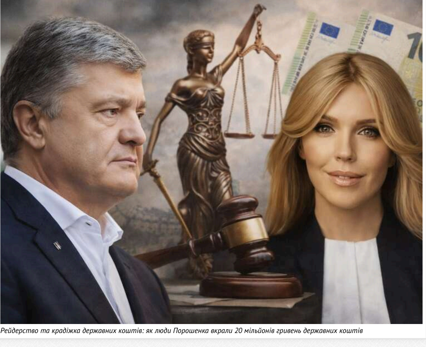
Рейдерство та крадіжка державних коштів: як люди Порошенка вкрали 20 мільйонів гривень державних коштів

У центрі Києва розгортається історія, яка більше нагадує підручник із корпоративних війн 1990-х, ніж події 2026 року. Йдеться про справу перехопити контроль над підприємством, щоб зберегти політичний одіс і перерозподілити десятки мільйонів гривень.