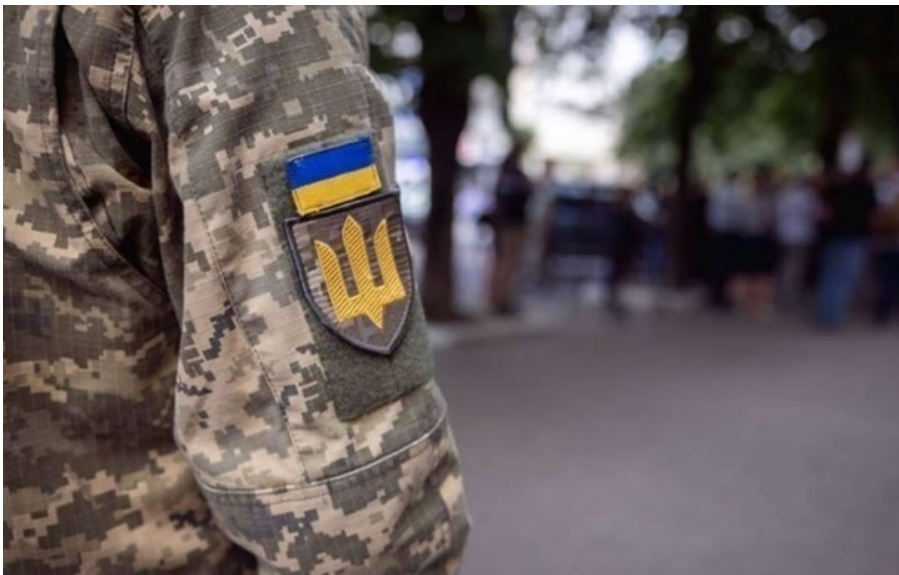
В Одессе произошел конфликт с представителем ТЦК

Прохожие перекрыли выезд с придомовой территории, после чего представитель ТЦК применил травматическое оружие в сторону одного из прохожих.