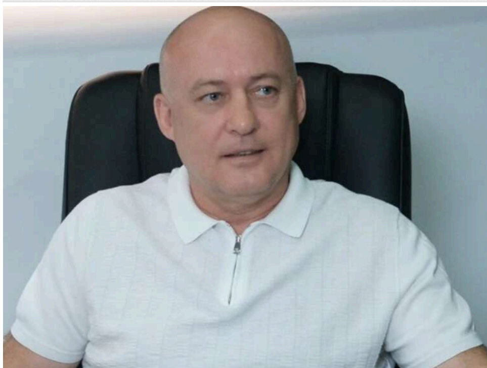
Анатомія рейдерства: як за 2000 гривень Глиняний захопив активи на 500 мільйонів і довів "Преміорі" до банкрутства

Північний апеляційний господарський суд в складі колегії суддів Владимиренко С.В., Демидової А.М. та Ходаківської І.П. скасовує рішення першої інстанції та задовольняє позов Глиняного. Визнано нову структуру капіталу: 80% - Глиняному, 20% - Premiorri LTD.