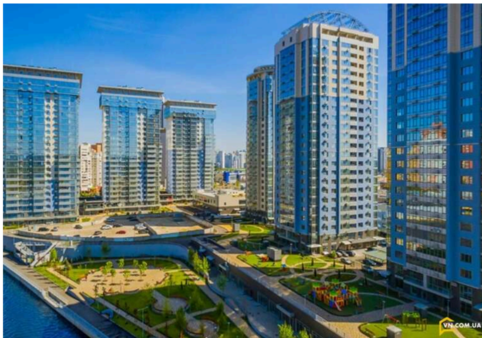
Набережна Дніпра під замком: Київрада та ЖК River Stone ігнорують рішення Верховного Суду

Півкілометрова набережна біля ЖК River Stone, що в урочищі Берковщина у Дарницькому районі Києва, лишилася зачненою для киян. Днями, нагадаємо, Верховний Суд зобов'язав компанію відкрити вільний прохід гідропорудою, визнавши незаконними усі ворота та шлагбауми, встановлені ще забудовником. На відео, відзнятому прокуратурою, видно, що просто "з вулиці" потрапити на закриту територію нині неможливо.